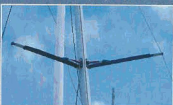
Barres de flèche contemporaines réglables.

ont donné un sacré coup de vieux mais, avant de lui offrir un enterrement de première classe, mieux vaudrait se pencher sur son rapport prix/potential. Disposer d'un bateau neuf, complet, et à partir de 3 668 euros (24 000 francs) n'est pas donné à toutes les séries, même s'il faut