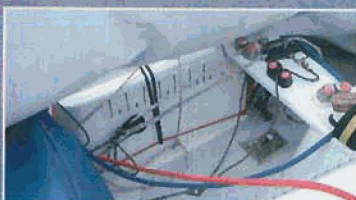
Les Vaurien Faccenda sont les mieux préparés.