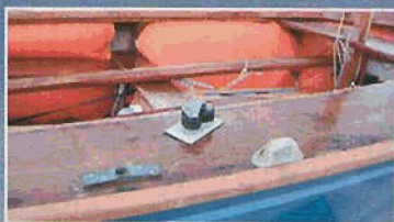
Dame de nage en bronze, filoir en Rilsan et taquet-coinceur moderne.

Aujourd'hui, l'association française ne peut guère compter que sur elle-même, assez loin des préoccupations d'une Fédération qui fouette d'autres chats et, paradoxalement, plus en contact avec l'ISAF, classe internationale oblige! Ayant cessé d'être un bateau d'école de voile depuis le milieu