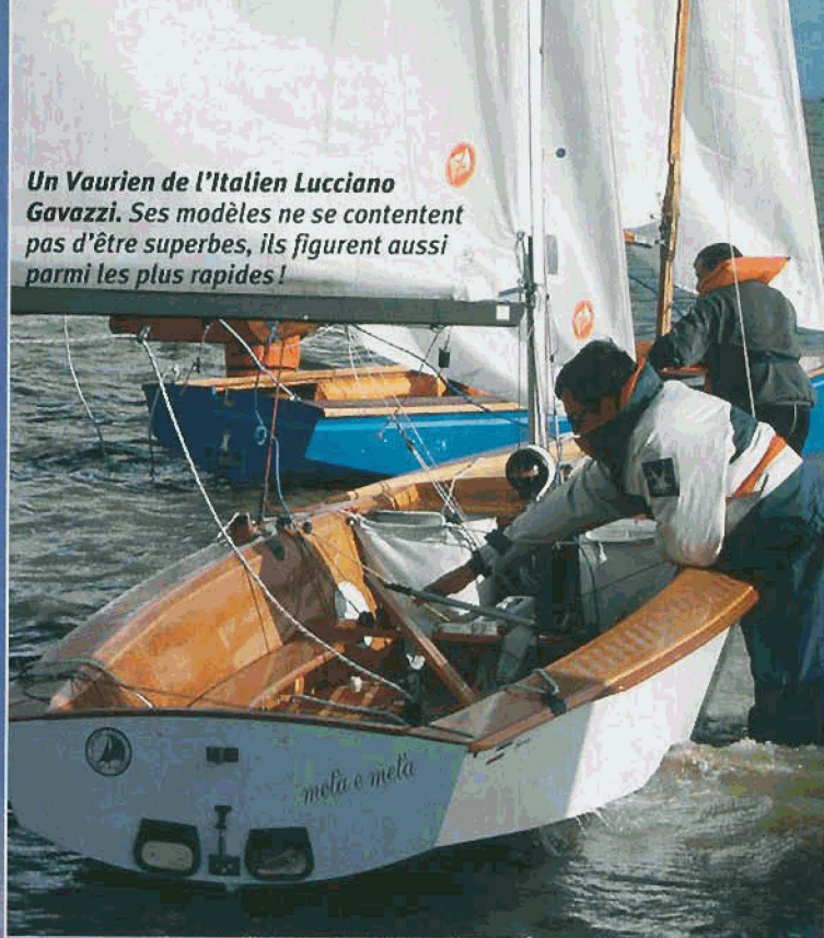
Un Vaurien de l'Italien Lucciano Gavazzi. Ses modèles ne se contentent pas d'être superbes, ils figurent aussi parmi les plus rapides!

des années 70, le Vaurien a graduellement perdu de son activité, même s'il continue à faire le bonheur de centaines de familles en vacances. Certes, les nouveaux dériveurs lui