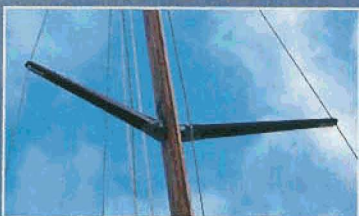
Barres de flèche en bois. A l'origine, le Vaurien n'en avait pas.

des années 70, le Vaurien a graduellement perdu de son activité, même s'il continue à faire le bonheur de centaines de familles en vacances. Certes, les nouveaux dériveurs lui